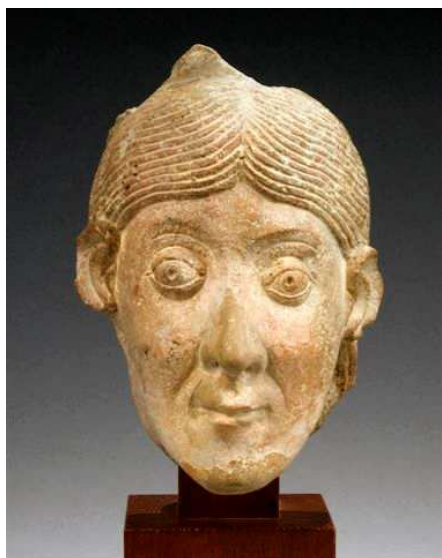
Bourgogne, vers 1125/1140. H.18 cm L.12,5 cm P.11 cm. Soclée.

Celui présenté ici, en forme de lion sans collerette, fait partie des premiers modèles d'aquamanile que l'on date de la première moitié du XIII ème siècle. Il est très proche d'un exemplaire du musée de Viterbe provenant de l'église Sainte-Marie de la ville (O. v. Falke et E. Meyer, Romanische Leuchter und Gefässe Giessgefässe der Gotik , Berlin, 1935, Abb.361) ou bien encore, mais en plus grand, de celui conservé au Kunstgewerbemuseum de Prague, Inv.Nr.4.518 ( Op. cit. , Abb.361a). Objet emblématique du Moyen Age, l'aquamanile en bronze fascina les plus grands collectionneurs du siècle dernier qui se devaient d'en posséder plusieurs exemplaires. Celui du Docteur Maillant a ainsi fait partie de la prestigieuse collection des Frères Bourgeois, figures très influentes du marché de l'art allemand, qui fut dispersée à Cologne en octobre 1904 et qui en comptait une demi-douzaine. En parfait état de conservation, bénéficiant d'une patine profonde irréprochable, ce modèle à la ligne élégante et sévère rend compte de l'étroit syncrétisme entre les civilisations médiévales de l'Orient et de l'Occident.