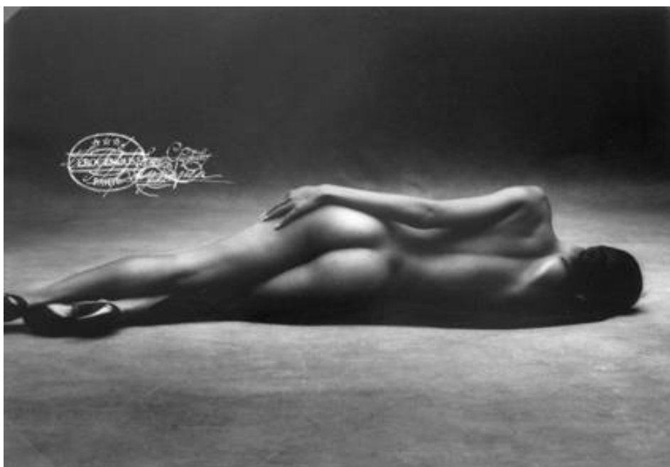
102 – Francis GIACOBETTI - Erogenous