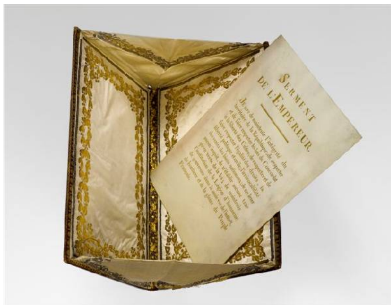
N°345 - Manuscrit calligraphié du Serment de l'Empereur à son Sacre, dans son portefeuille (2 décembre 1804). Vendu : 31 000 €

Le Vendredi 13 février 2009, PIASA assistée de Thierry Bodin, expert, a effectué une importante vente de lettres et manuscrits autographes et documents historiques. Le produit total de la vente s'est élevé à 825 500 € (frais compris), soit 97% de produit vendu .